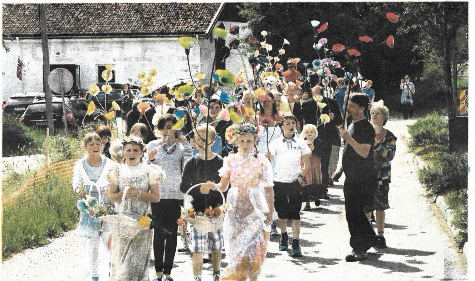
BLOMSTERTOGET: Barn og unge var sterkt representert under Wergelandsfesten på Tangen i går.

– Wergeland har betydd mye for mange og skal vi unngå katastrofer i framtiden må vi lære barna om det Wergeland sto for. Han har blant annet sagt at det land som eier frihet, har ære nok. Det er vise ord som har hjulpet man-