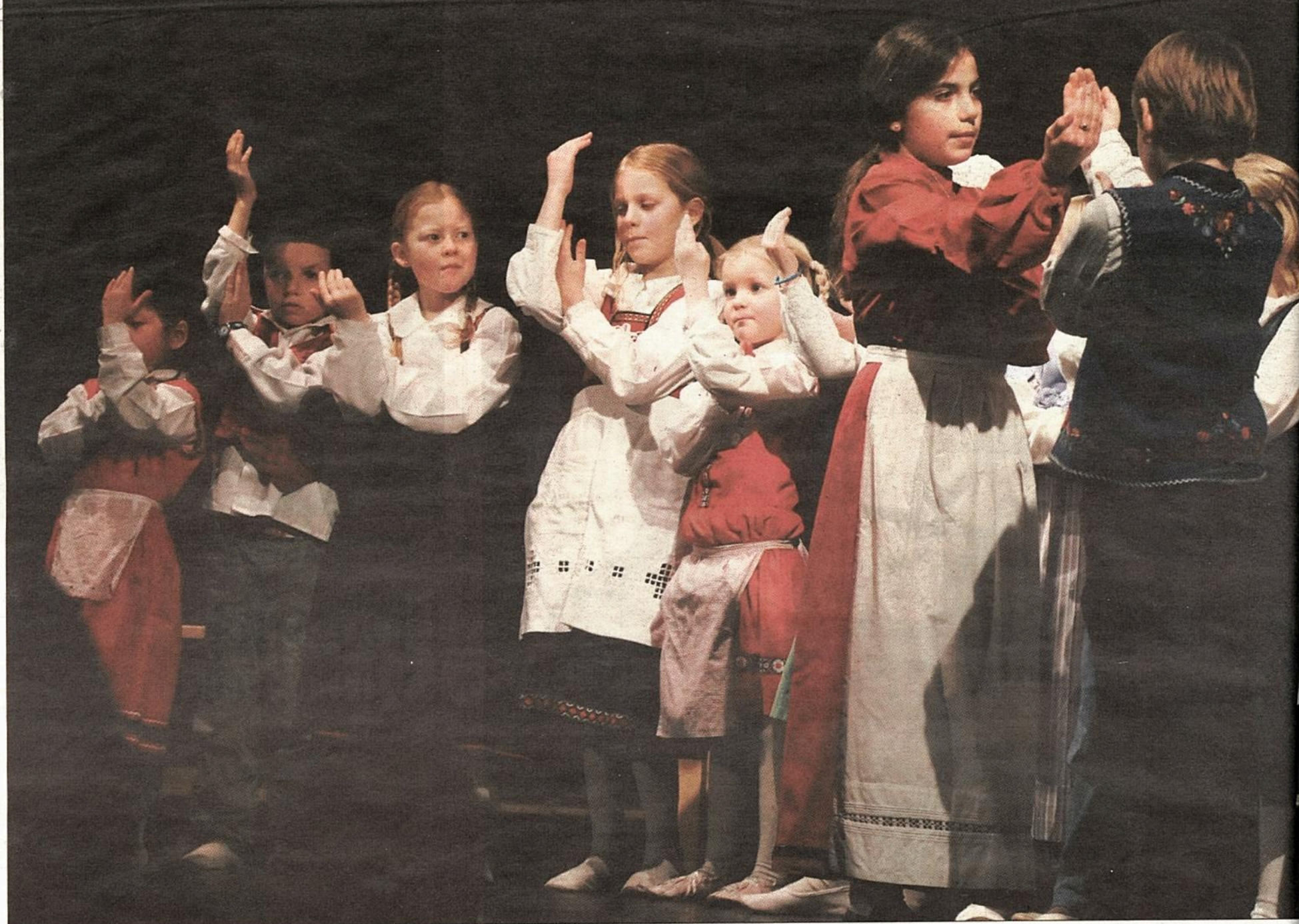
JUBILEUMSFORSTILLING: Grav litteratur- og teatergruppe feiret sitt 20-årsjubileum med forestilling i aulaen på Steinerskolen i Bærum.

Teater. De unge skuespillerne i Grav litteratur- og teatergruppe skulle huske lange tekster da de satte opp sin jubileumsforestilling. Det blir det små nerver av.